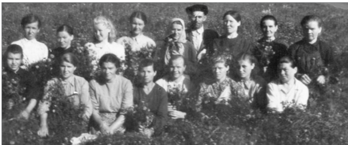
● Полеводческая бригада. 1953 год.