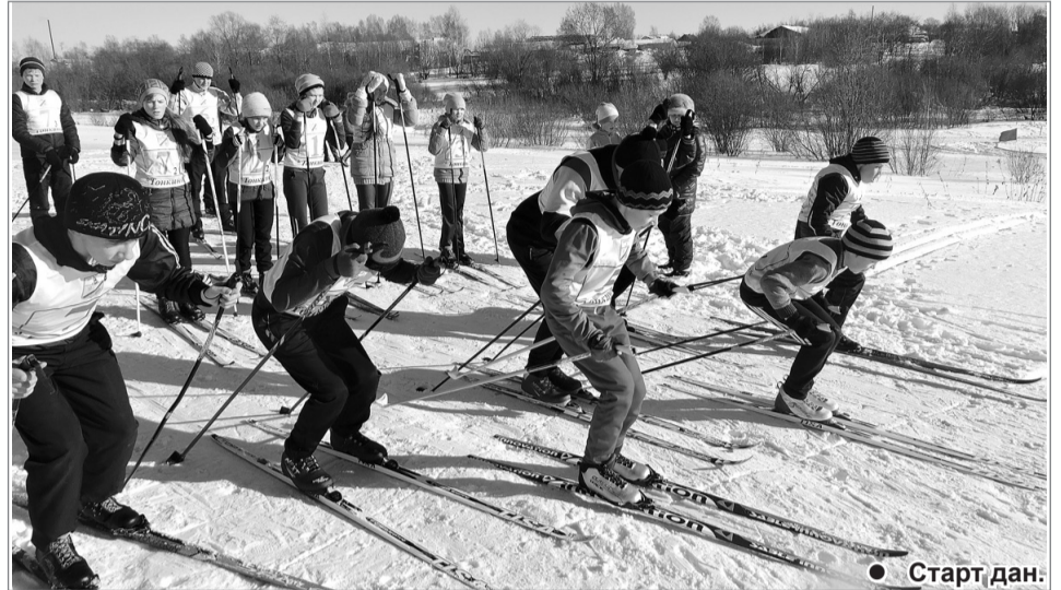
● Старт дан.

Хорошо отстрелялись ученики из Пахутино. У них был всего один штрафной круг