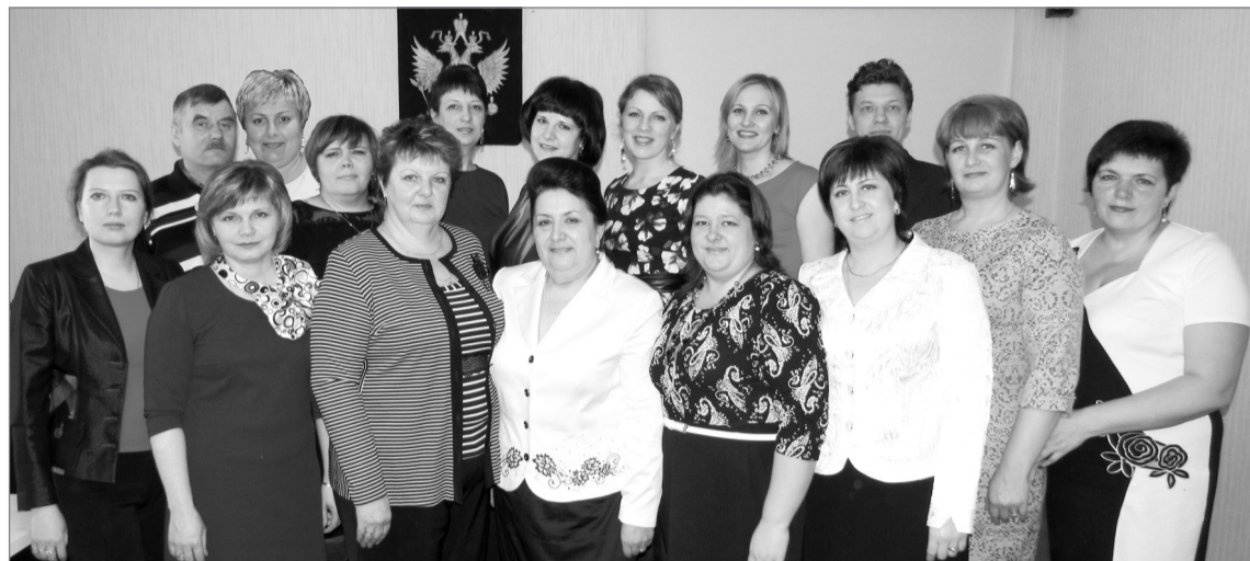
• Коллектив Управления финансов в настоящее время.

Наряду с юбилеем района свое 80-летие отмечает Управление финансов администрации Тонкинского района. Ни один государственный строй, ни один уровень власти не может существовать без бюджета и финансов.