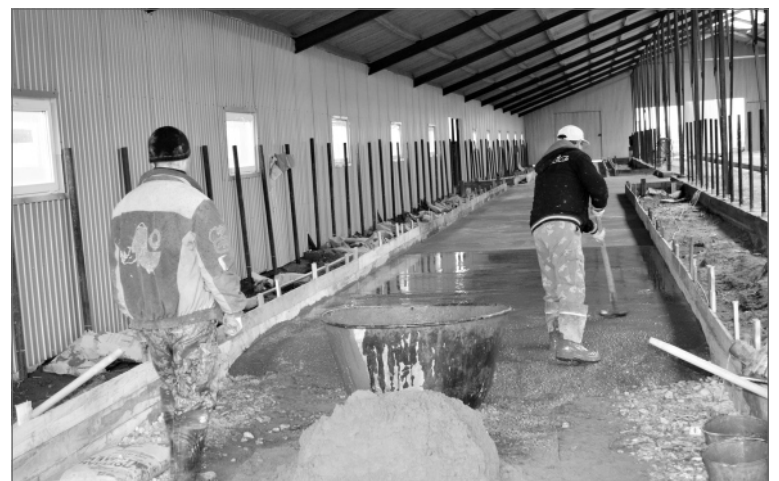
■ Заливка полов на строящейся ферме.