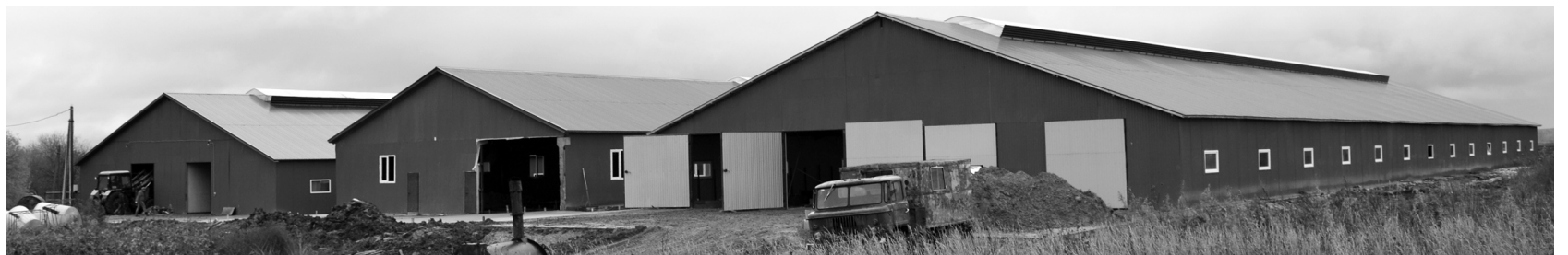
■ Животноводческий комплекс в ООО «Агрофирма «Нива».