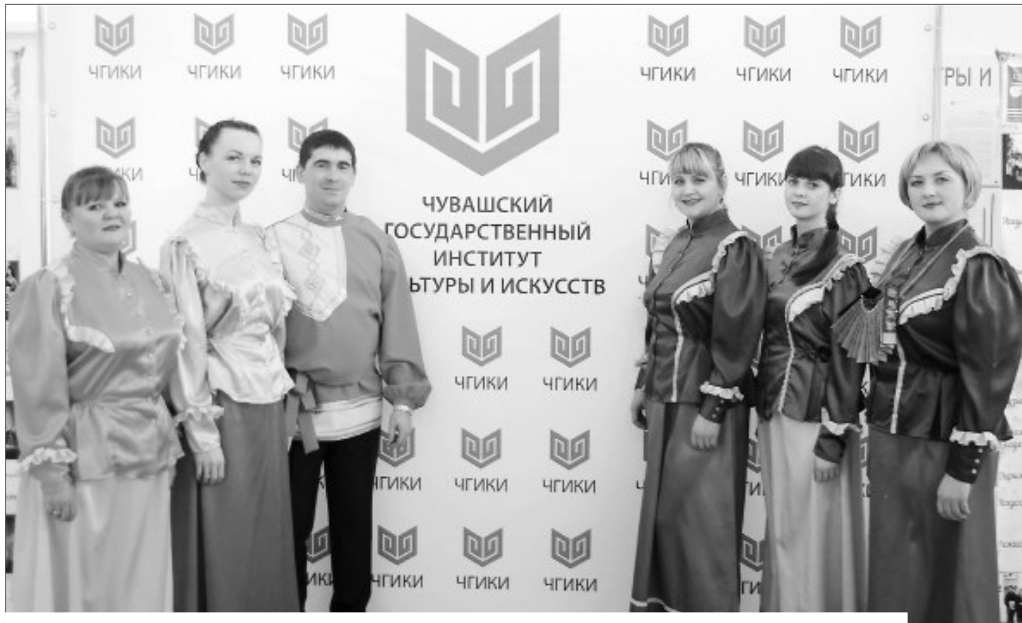
Ансамбль песни «Гармония», действующий при районном доме культуры, хорошо знаком по своим выступлениям не только тонкинцам, но и жителям других населенных пунктов. Музыкальный коллектив молодых исполнителей – частый гость на многих сельских праздниках.