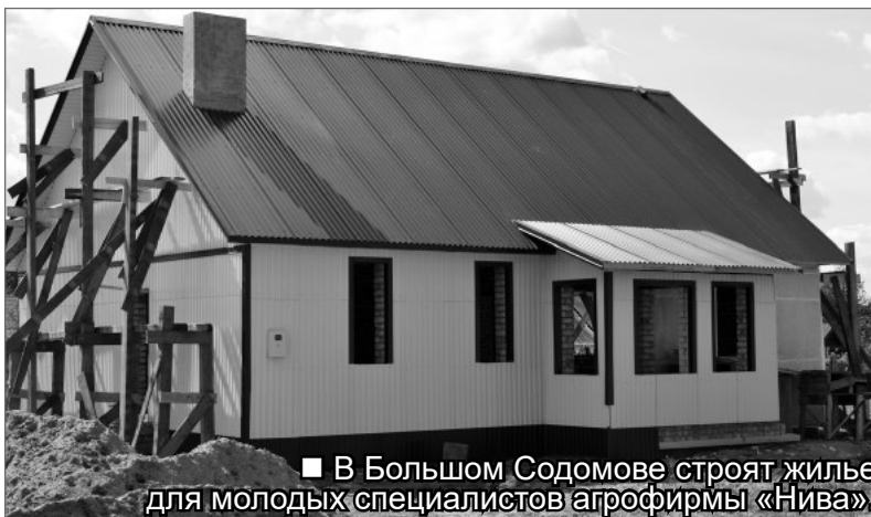
■ В Большом Содомове строят жилье для молодых специалистов агрофирмы «Нива».

зарабатывает на жизнь и вахтовым способом. Сельская администрация, со своей стороны, не оставляет без внимания жителей деревни. Случился, например, обрыв электролинии во время ледяного дождя, что остановило водоподачу в дома. Так на помощь пришли большесодомовцы, организовав доставку воды молоковозом «Агрофирмы «Нива».