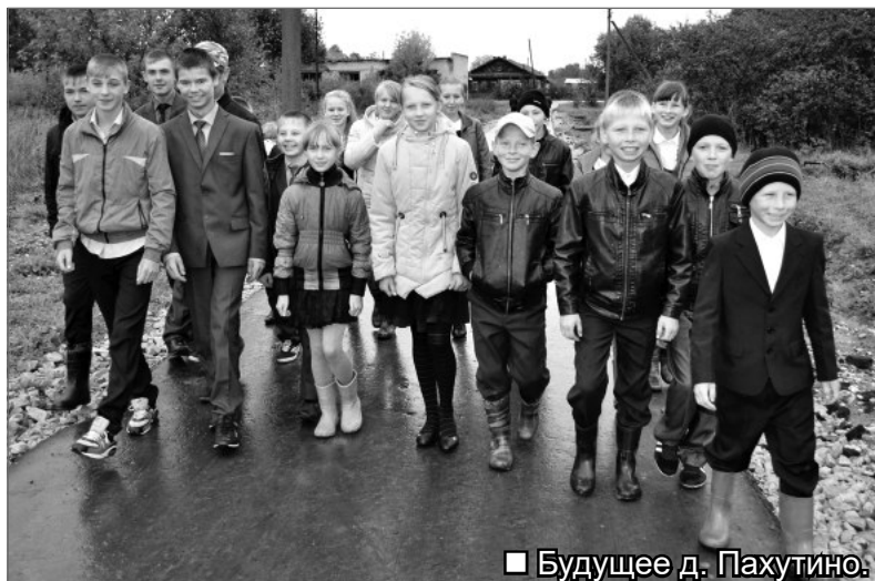
■ Будущее д. Пахутино.

Часть большесидоровского трудоспособного населения (и оно пока еще здесь имеется) занято в качестве обслуживающего персонала дома-интерната для престарелых в Зеленых Лугах. Кто-то трудится в лесоперерабатывающей отрасли райцентра, а есть, кто